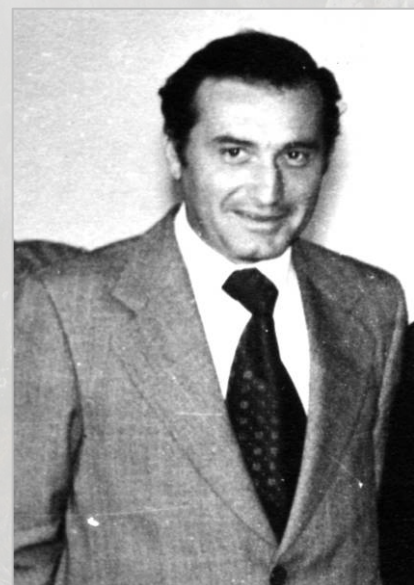
Александр Борисович Беликов